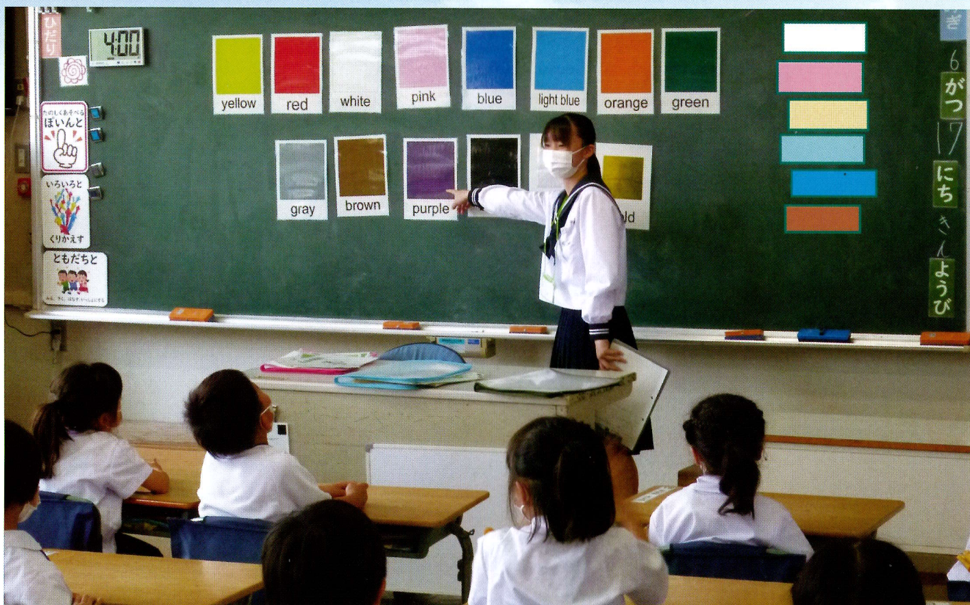
香川大学教育学部附属坂出小学校での支援活動の様子

教育創造コースを志望する人を対象とした自己推薦選抜を実施しています。県外や第一学区からも出願可能です。